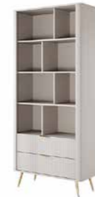
A regał 88,2 / 193,8 / 38 cm → ↑ ↘