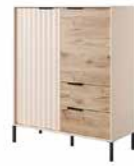
A komoda wysoka 2d2s 103,3 / 123,4 / 39,5 cm → ↑ ↘