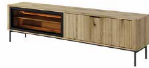
E stolik rtv 200 2d LED 200 / 53,2 / 38 → ↑ ↘