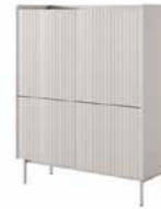
A komoda wysoka 4d 103,2 / 126,2 / 38 cm → ↑ ↘