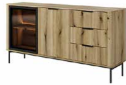
C komoda 163 2d3s LED 163,2 / 81,2 / 38 cm → ↑ ↘