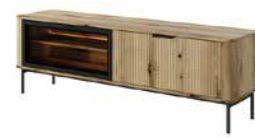
F stolik rtv 163 2d LED 163,2 / 53,2 / 38 cm → ↑ ↘