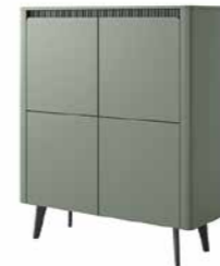
A komoda wysoka 4d 113,2 / 130,6 / 38 cm → ↑ ↘