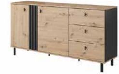
D komoda 2d3s 165,1 / 82,2 / 40 cm → ↑ ↘