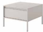
F stolik kawowy 1s 68 / 48,4 / 68 cm → ↑ ↘