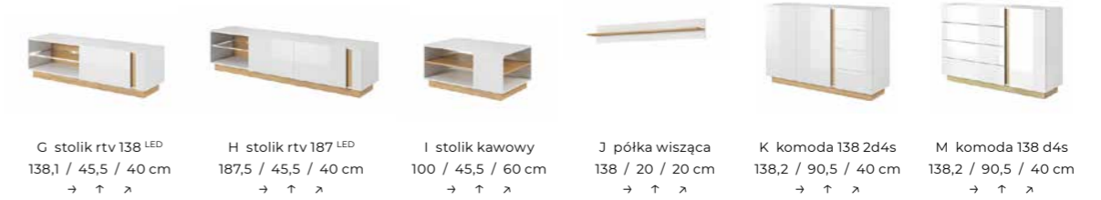
G stolik rtv 138 LED 138,1 / 45,5 / 40 cm → ↑ ↘