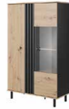
A witryna niska LED 90,1 / 148,8 / 40 cm → ↑ ↘