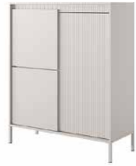
A komoda wysoka 3d 103,5 / 123,4 / 39,5 cm → ↑ ↘