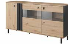
E komoda 3d witryna LED 165,1 / 82,2 / 40 cm → ↑ ↘