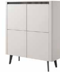
A komoda wysoka 4d 113,2 / 130,6 / 38 cm → ↑ ↘