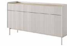
B komoda 153 3s3d 153 / 82,2 / 38 cm → ↑ ↘