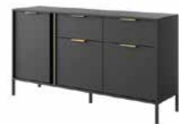
B komoda 153 3d2s 153,1 / 81,4 / 39,5 cm → ↑ ↘