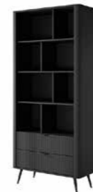
A regał 88,2 / 193,8 / 38 cm → ↑ ↘