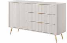
D komoda 138 d3s 138,2 / 81,2 / 38 cm → ↑ ↘