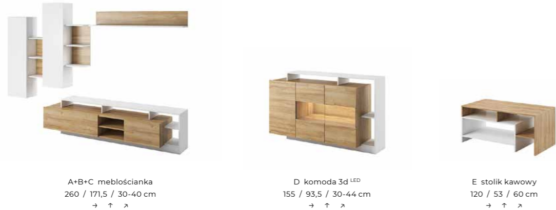
A+B+C meblościanka 260 / 171,5 / 30-40 cm → ↑ ↘