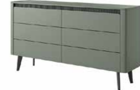
C komoda 163 6s 163,2 / 86,4 / 38 cm → ↑ ↘