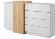
F komoda 2d4s 160 / 93,5 / 45 cm → ↑ ↘