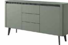
B komoda 163 2d3s 163,2 / 86,4 / 38 cm → ↑ ↘