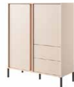
A komoda wysoka 2d2s LED 103,3 / 123,4 / 39,5 cm → ↑ ↘