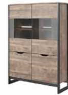
B witryna niska LED 108,6 / 150 / 39,6 cm → ↑ ↘