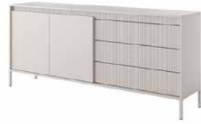
C komoda 187 2d3s 187,1 / 81,4 / 39,5 cm → ↑ ↘