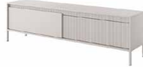
E stolik rtv 187 2d 187,1 / 53,4 / 39,5 cm → ↑ ↘