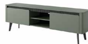
D stolik rtv 187 2d 187,2 / 58,4 / 38 cm → ↑ ↘