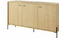
C komoda 157 3d 156,8 / 81,4 / 39,5 cm → ↑ ↘