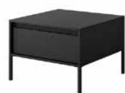
F stolik kawowy 1s 68 / 48,4 / 68 cm → ↑ ↘