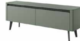
E stolik rtv 163 2d 163,2 / 58,4 / 38 cm → ↑ ↘