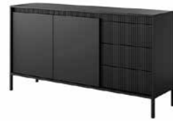
B komoda 153 2d3s 153,5 / 81,4 / 39,5 cm → ↑ ↘