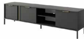
F stolik rtv 203 202,9 / 53,4 / 39,5 cm → ↑ ↘