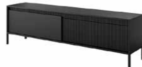
E stolik rtv 187 2d 187,1 / 53,4 / 39,5 cm → ↑ ↘