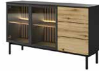
C komoda 150 2d3s LED 149,9 / 84,8 / 39,4 cm → ↑ ↘