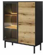
B witryna niska LED 100,1 / 125,4 / 39,4 cm → ↑ ↘