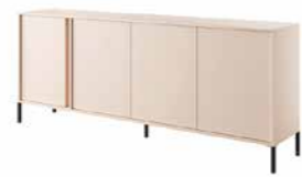
E komoda 203 4d LED 202,9 / 81,4 / 39,5 cm → ↑ ↘