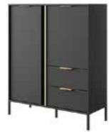
A komoda wysoka 2d2s 103,3 / 123,4 / 39,5 cm → ↑ ↘