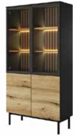
A witryna wysoka LED 100,1 / 188,4 / 39,4 cm → ↑ ↘