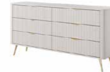
B komoda 163 6s 163,2 / 81,2 / 38 cm → ↑ ↘