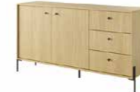
B komoda 157 2d3s 156,8 / 81,4 / 39,5 cm → ↑ ↘