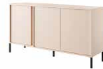
C komoda 153 3d LED 153,1 / 81,4 / 39,5 cm → ↑ ↘