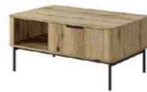
K stolik kawowy 2s 96,9 / 42,4 / 60,2 cm → ↑ ↘