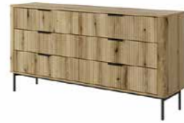
H komoda 163 6s 163,2 / 81,2 / 38 cm → ↑ ↘