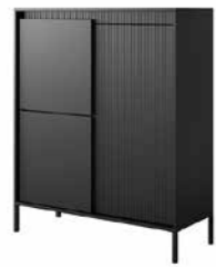
A komoda wysoka 3d 103,5 / 123,4 / 39,5 cm → ↑ ↘