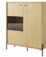
A witryna LED 107 / 123,4 / 39,5 cm → ↑ ↘