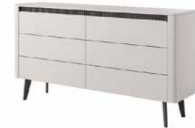
C komoda 163 6s 163,2 / 86,4 / 38 cm → ↑ ↘