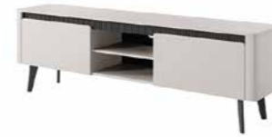
D stolik rtv 187 2d 187,2 / 58,4 / 38 cm → ↑ ↘