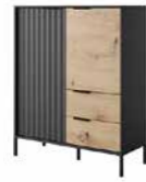
A komoda wysoka 2d2s 103,3 / 123,4 / 39,5 cm → ↑ ↘