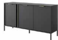
C komoda 153 3d 153,1 / 81,4 / 39,5 cm → ↑ ↘