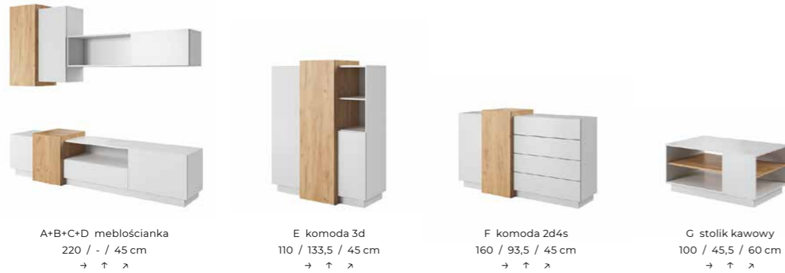
A+B+C+D meblościanka 220 / - / 45 cm → ↑ ↘