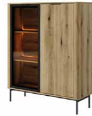
B witryna niska LED 113,2 / 134,1 / 38 cm → ↑ ↘