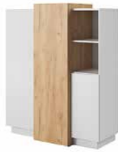
E komoda 3d 110 / 133,5 / 45 cm → ↑ ↘