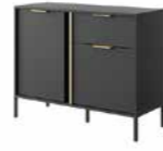
D komoda 103 2d1s 103,3 / 81,4 / 39,5 cm → ↑ ↘