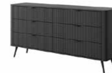
B komoda 163 6s 163,2 / 81,2 / 38 cm → ↑ ↘