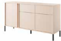
B komoda 153 3d2s LED 153,1 / 81,4 / 39,5 cm → ↑ ↘