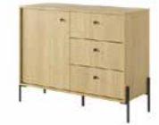
D komoda 107 d3s 107 / 81,4 / 39,5 cm → ↑ ↘