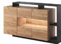
D komoda 3d LED 155 / 93,5 / 30-44 cm → ↑ ↘