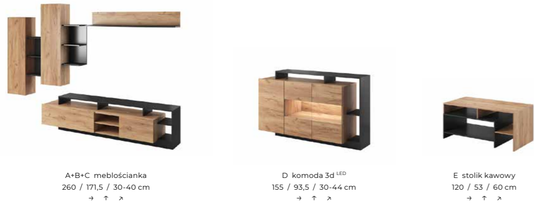
A+B+C meblościanka 260 / 171,5 / 30-40 cm → ↑ ↘