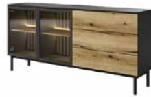
D komoda 180 2d3s LED 179,9 / 84,8 / 39,4 cm → ↑ ↘