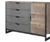
G komoda 138 d4s 137,8 / 99,2 / 39,6 cm → ↑ ↘