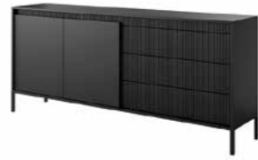
C komoda 187 2d3s 187,1 / 81,4 / 39,5 cm → ↑ ↘