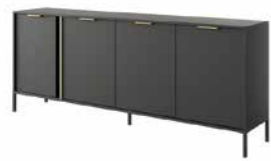
E komoda 203 4d 202,9 / 81,4 / 39,5 cm → ↑ ↘