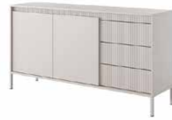
B komoda 153 2d3s 153,5 / 81,4 / 39,5 cm → ↑ ↘