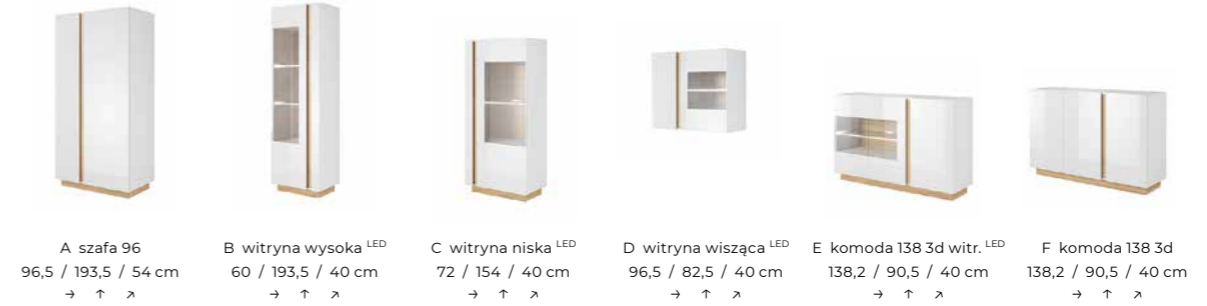
A szafa 96 96,5 / 193,5 / 54 cm → ↑ ↘