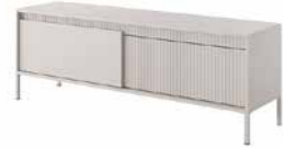
D stolik rtv 153 2d 153,5 / 53,4 / 39,5 cm → ↑ ↘