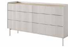
C komoda 153 6s 153 / 82,2 / 38 cm → ↑ ↘