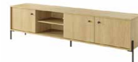
E stolik rtv 207 206,6 / 53,4 / 39,5 cm → ↑ ↘