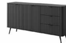
C komoda 163 2d3s 163,2 / 81,2 / 38 cm → ↑ ↘