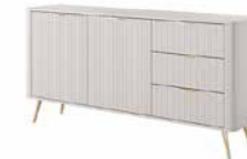
C komoda 163 2d3s 163,2 / 81,2 / 38 cm → ↑ ↘