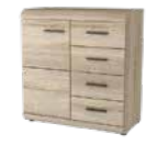
X komoda 80 80 / 86,5 / 42 cm → ↑ ↘