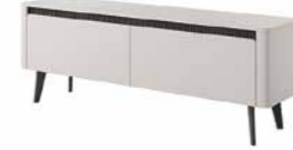
E stolik rtv 163 2d 163,2 / 58,4 / 38 cm → ↑ ↘