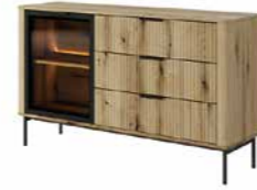
D komoda 138 d3s LED 138,2 / 81,2 / 38 cm → ↑ ↘