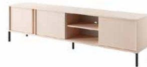
F stolik rtv 203 LED 202,9 / 53,4 / 39,5 cm → ↑ ↘