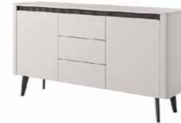
B komoda 163 2d3s 163,2 / 86,4 / 38 cm → ↑ ↘