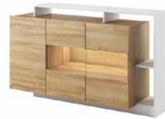
D komoda 3d LED 155 / 93,5 / 30-44 cm → ↑ ↘