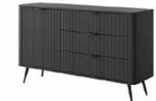
D komoda 138 d3s 138,2 / 81,2 / 38 cm → ↑ ↘